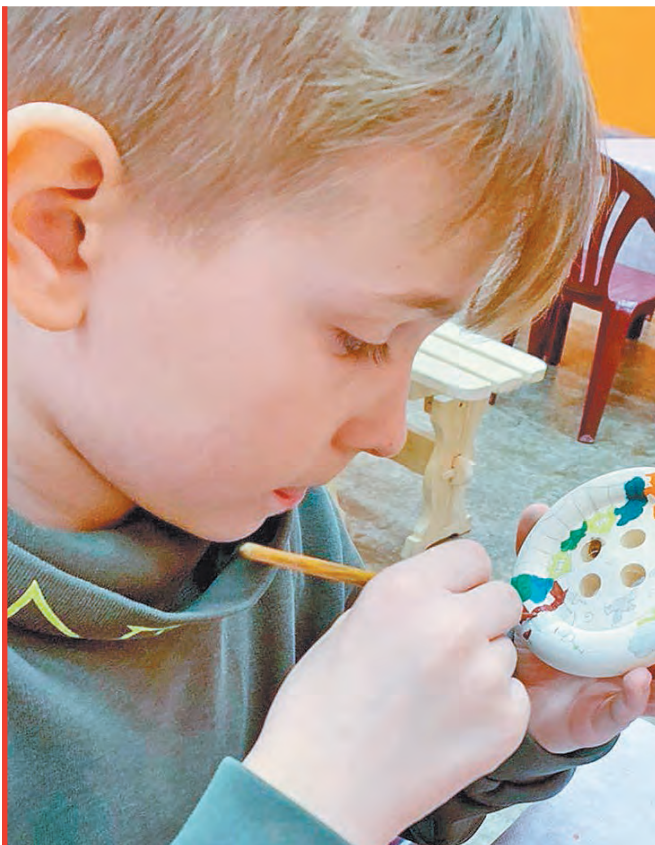
Работы детей пригодятся для будущего оформления галереи в выставочном зале.

Было бы странно, если бы живописцы обращались за дизай-