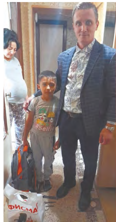
Акция «Собери ребенка в школу».

В рамках акции «Собери ребенка в школу» совет отцов совместно с местным отделением партии «Единая Россия» оказали помощь в приобретении канцелярских принадлежностей семье из Жукова. Об-