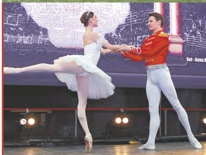
Выступление Имперского Русского балета.