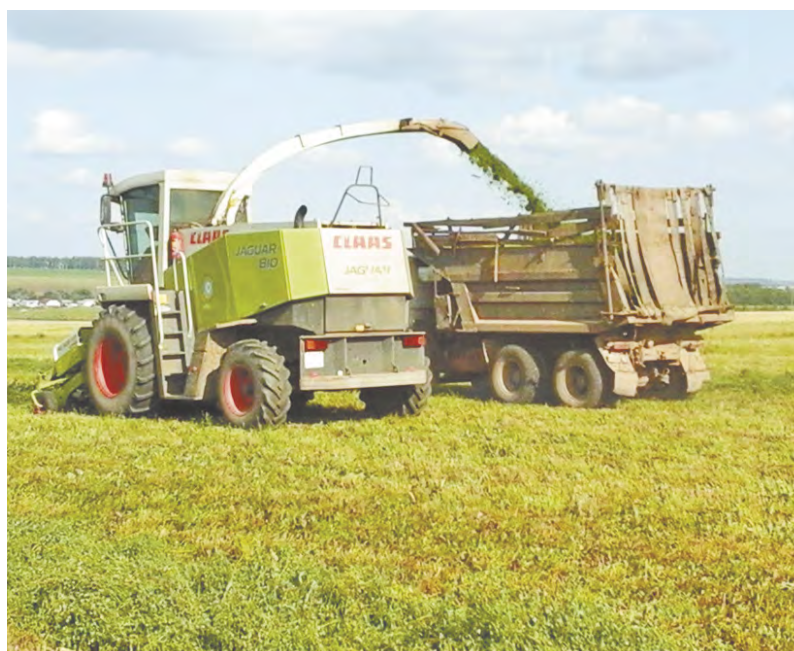
Заготовка кормов в ООО «ТН-Group» (Ульяновский район).