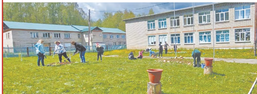
Михеевская (Улановская) школа, наши дни.