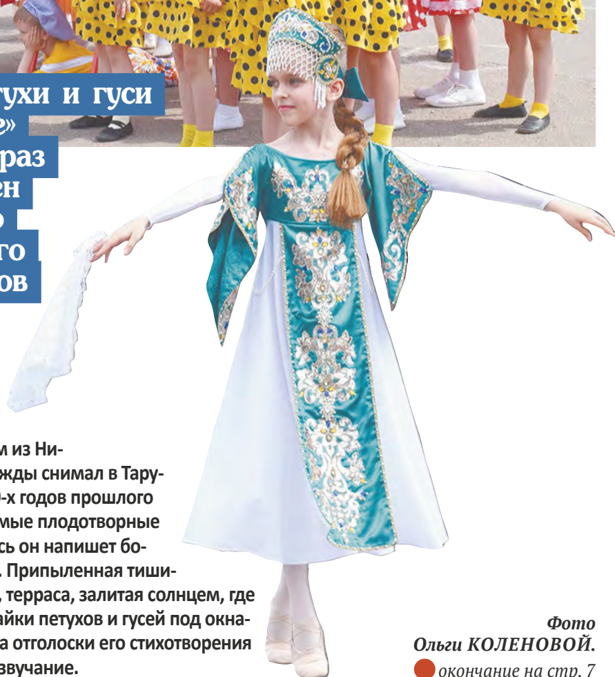
● окончание на стр. 7

Череду летних событий в городе на Оке открывает большой семейный праздник с узнаваемым названием из Николая Заболоцкого. Поэт дважды снимал в Тарусе дом на лето в середине 50-х годов прошлого века. Это были едва ли не самые плодотворные периоды его творчества: здесь он напишет более тридцати стихотворений. Припыленная тишина, прохлада окских берегов, терраса, залитая солнцем, где так легко работалось, — и стайки петухов и гусей под окнами. Спустя более чем полвека отголоски его стихотворения «Городок» получили особое звучание.