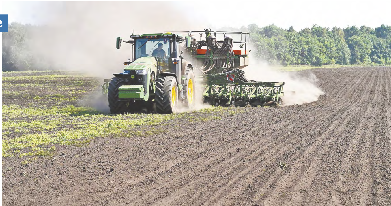
Сев в ООО «Калужская Нива».

Завершили работы и картофелеводы. Посажено второго хлеба на общей площади без малого 1750 гектаров. Справились с по-