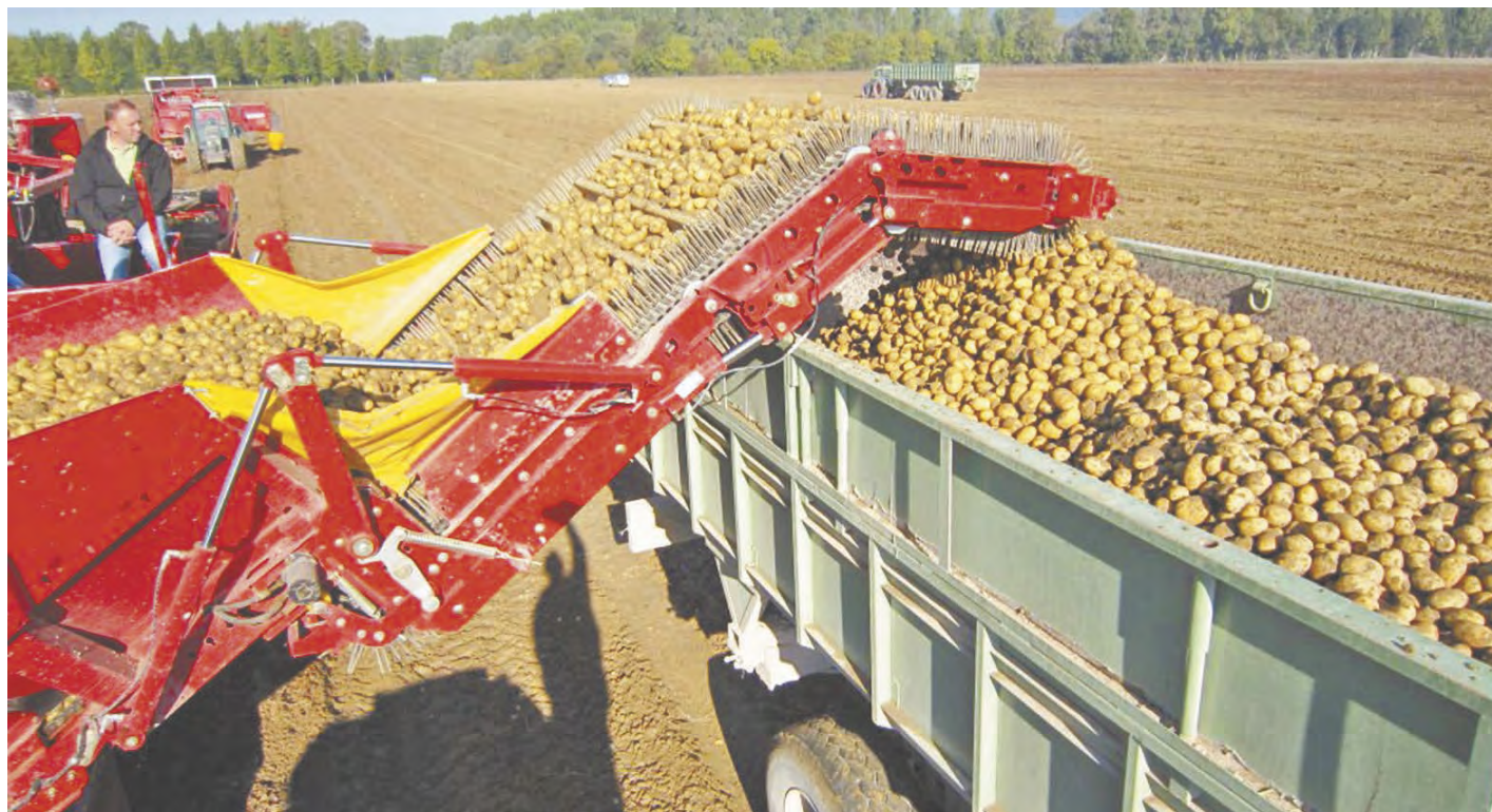
Уборка картофеля в ООО «Аврора».

Так можно сказать о плодовых культурах и овощах открытого грунта. К сбору урожая яблок поздних сортов приступили совсем недавно. А большинство овощей открытого грунта (свекла, морковь, капуста) еще ждет своего часа. Их