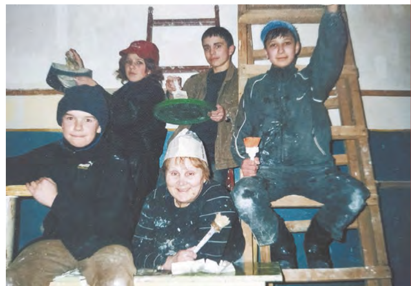
Ремонт класса, 2005.