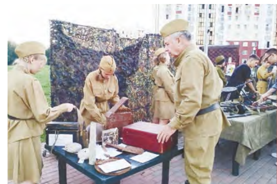
Выставка от Музея истории города Балабанова.

Как во времена юности наших родителей, перед киносеансом на танцплощадке звучали джазовые, эстрадные композиции в исполнении духового оркестра и солистов ДК, пары кружились в вальсе. Волонтеры предстали в образах стилиг. А песню «Мой адрес - Советский Союз» подпевали и взрослые, и, как ни странно, дети.