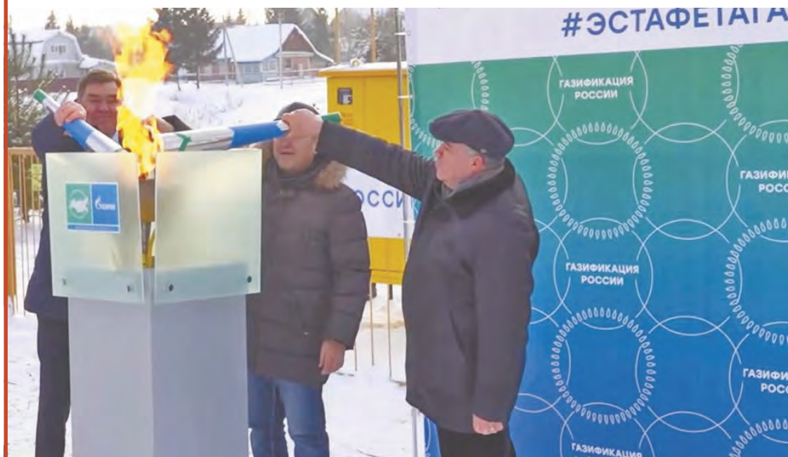
Запуск газопровода в сельском поселении «Совхоз «Победа», декабрь 2021 года.