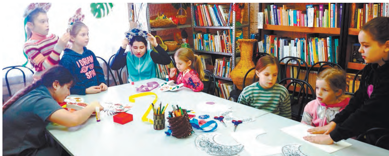
Фото библиотеки города Белоусова.