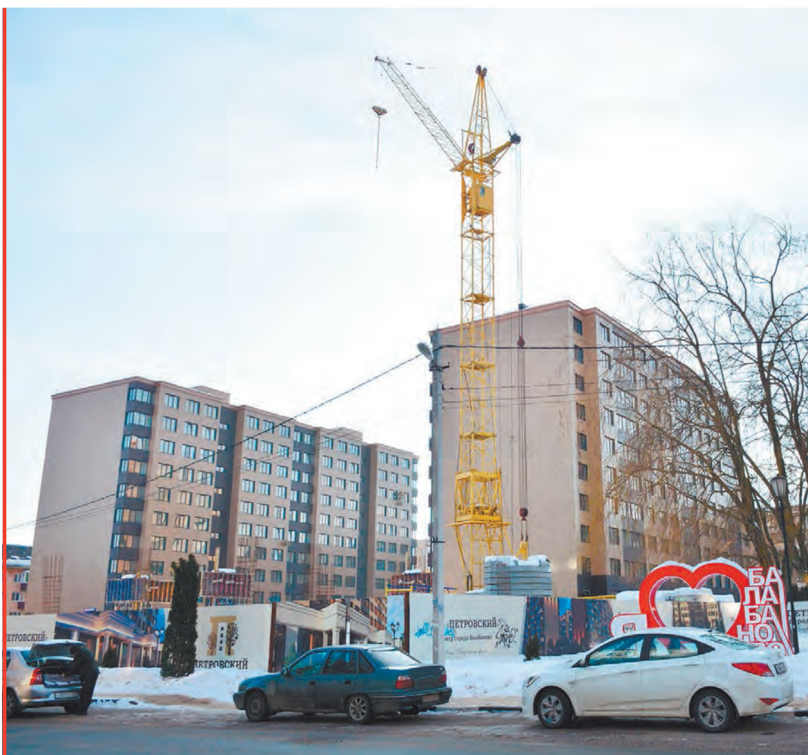
Строительство жилого комплекса Петровский.