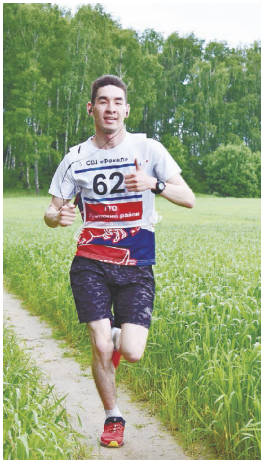
Кросс в День Святой Троицы, село Трубино.