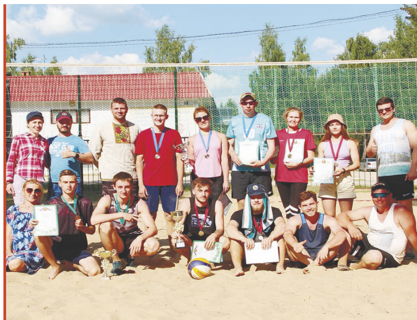
Районный турнир по пляжному волейболу.