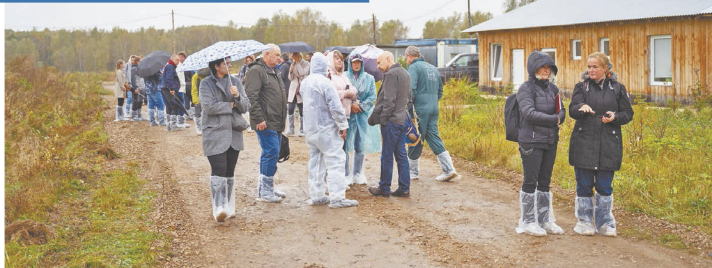
Туристы на «Экоферме Джерси».

Агротуризм для фермеров является важным дополнением к их основному бизнесу. По сути, это диверсификация сельхозпроизводства. Если в силу разных причин упадет спрос на основную продукцию, производимую фермерами, то сельский туризм станет для них спасительной соломинкой на рынке.