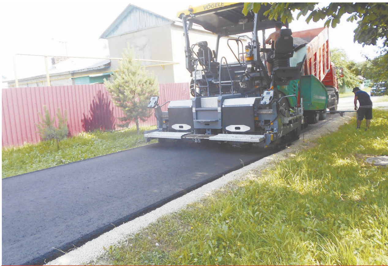
Михеево, укладка асфальта.

Виталий РОСТ.