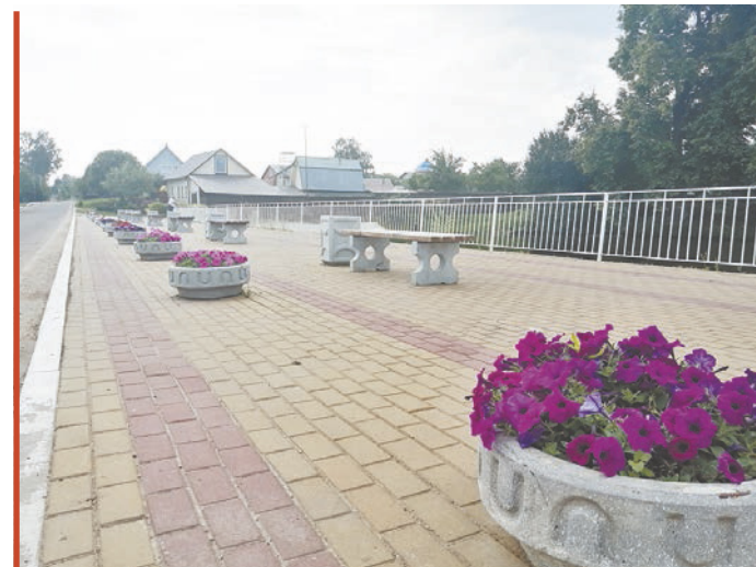
Медынь, цветники у Соломатинского пруда.

Но не только инфраструктурную сеть и ЖКХ затрагивает программа благоустройства. Так, на окраине деревни Глухово решено облагородить родник. Популярный