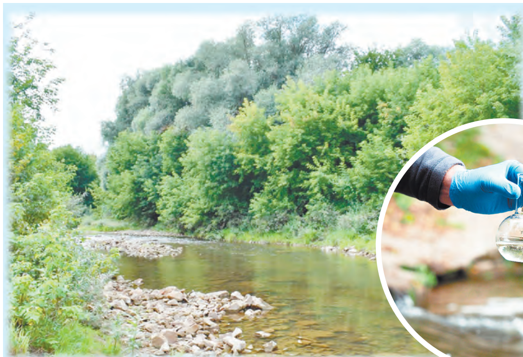
Река Таруса: купаться можно, но не в устье.

Подготовила Татьяна АНДРЮХИНА.