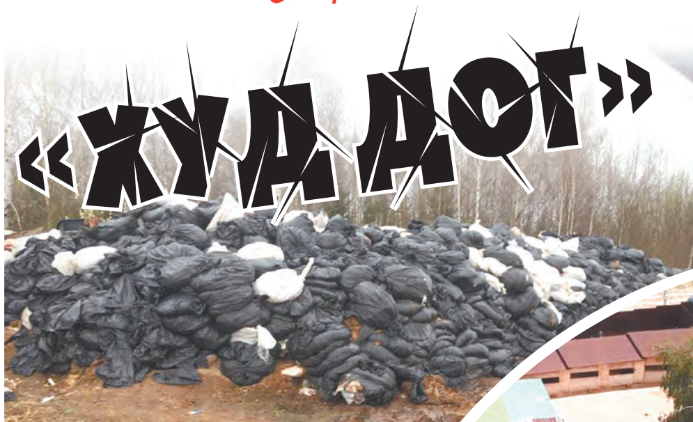
Органические отходы гниют у забора, источая неприятные запахи.