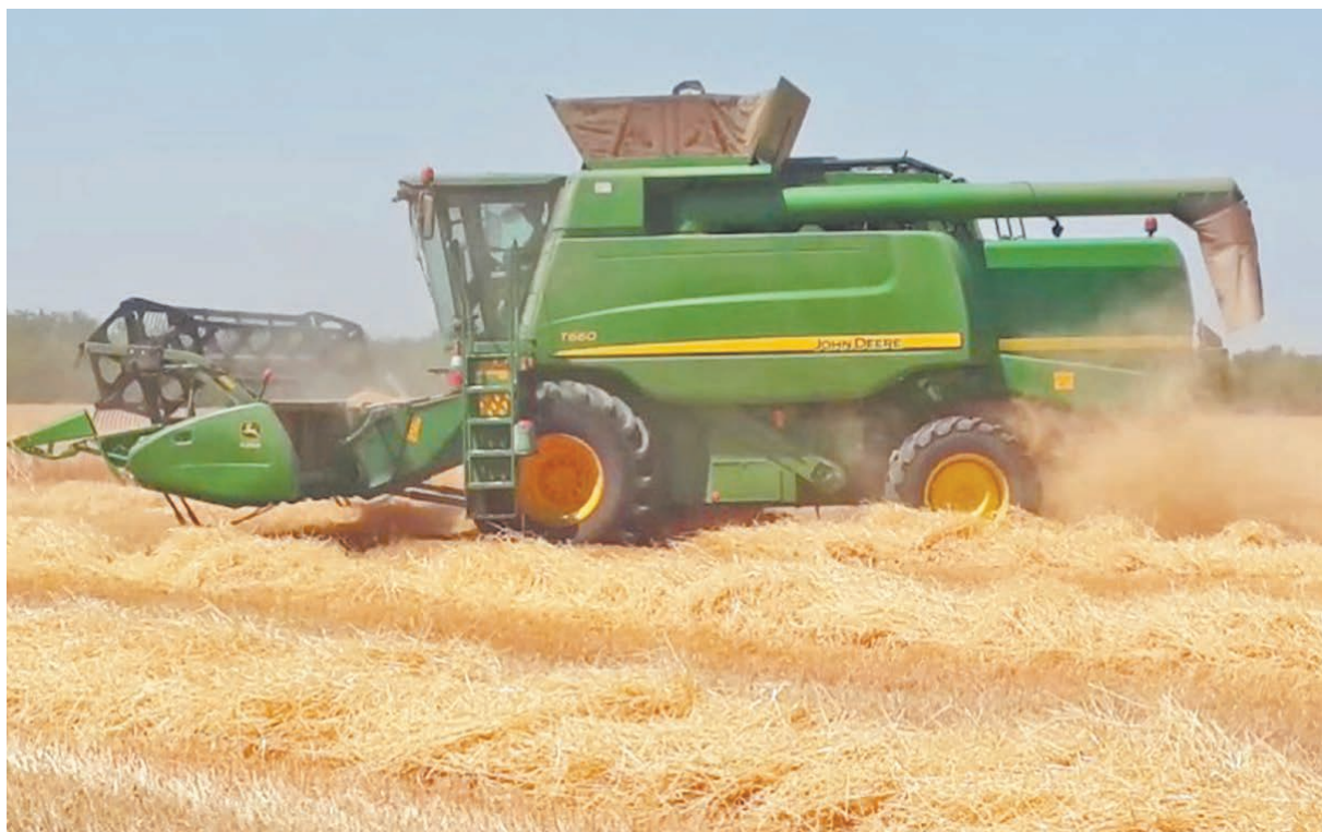
Уборка яровой пшеницы в ООО «Калужская нива».

Сроки завершения уборочной страды сместились из-за дождей. Зерновые убраны на большинстве площадей (около 80 % от плана).