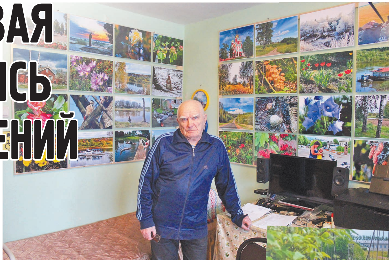
В своей комнате в интернате.

Вот так, с 60-х и вплоть до 90-х годов прошлого века Коржос всерьез