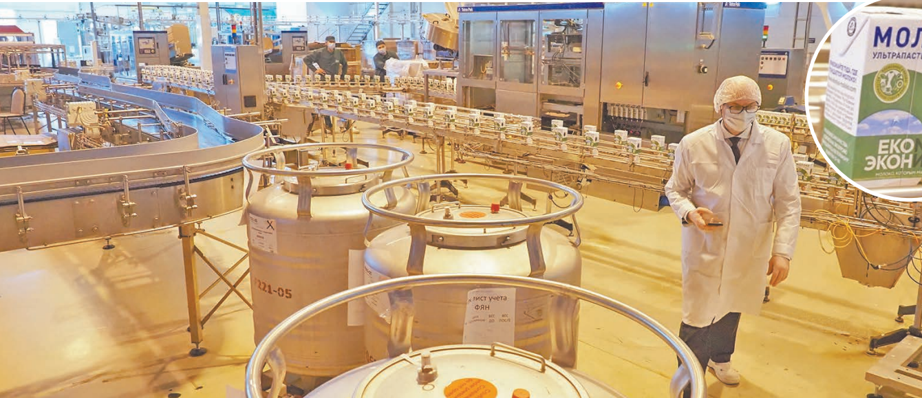
На производстве продукции ООО «Калужская нива».