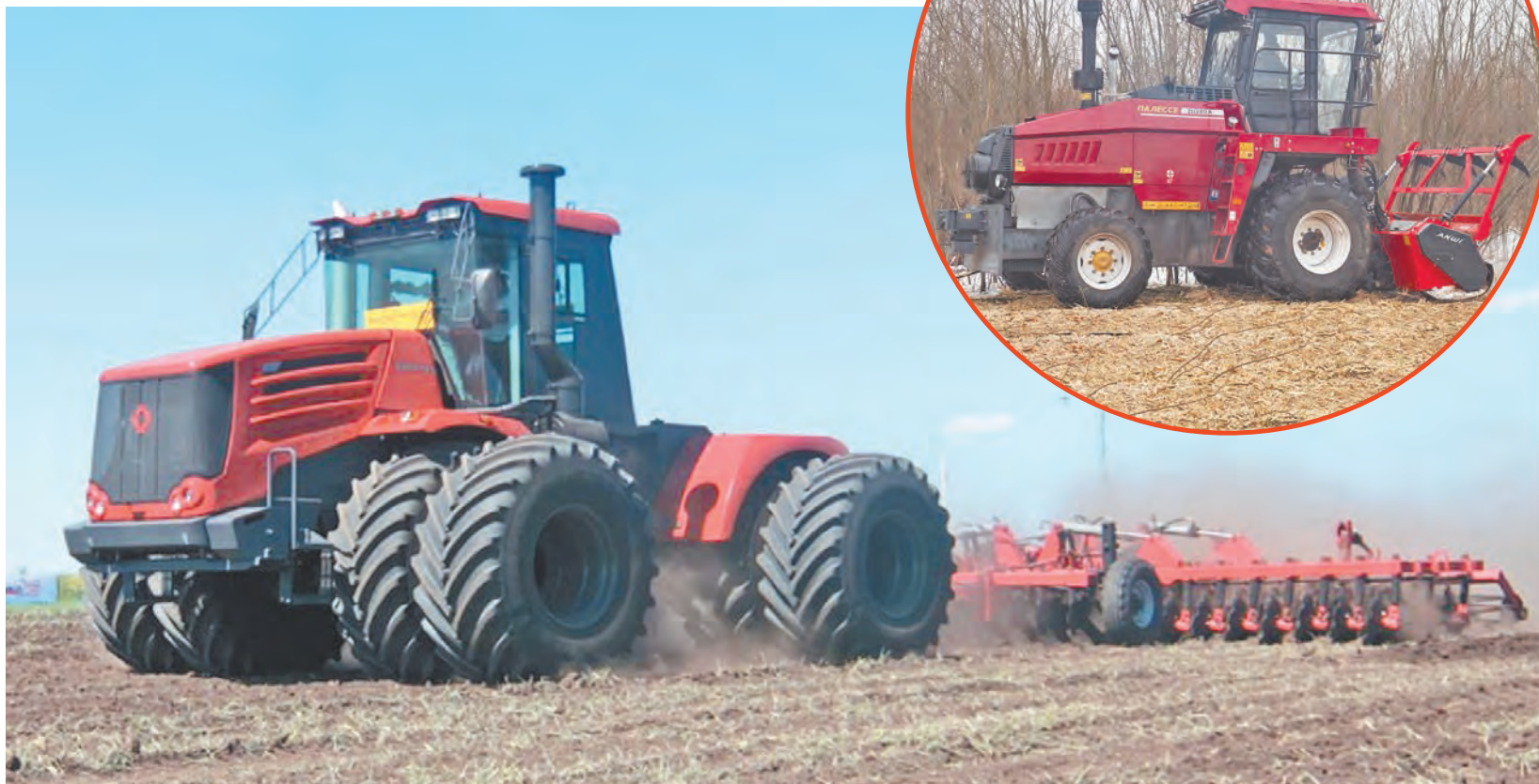
Российская и белорусская сельхозтехника на весенне-полевых работах.

Наступила весна. Для земледельцев это время активной подготовки к началу весенне-полевых работ, которым в этом году придается особое значение по обеспечению продовольственной безопасности населения в условиях международных санкций.