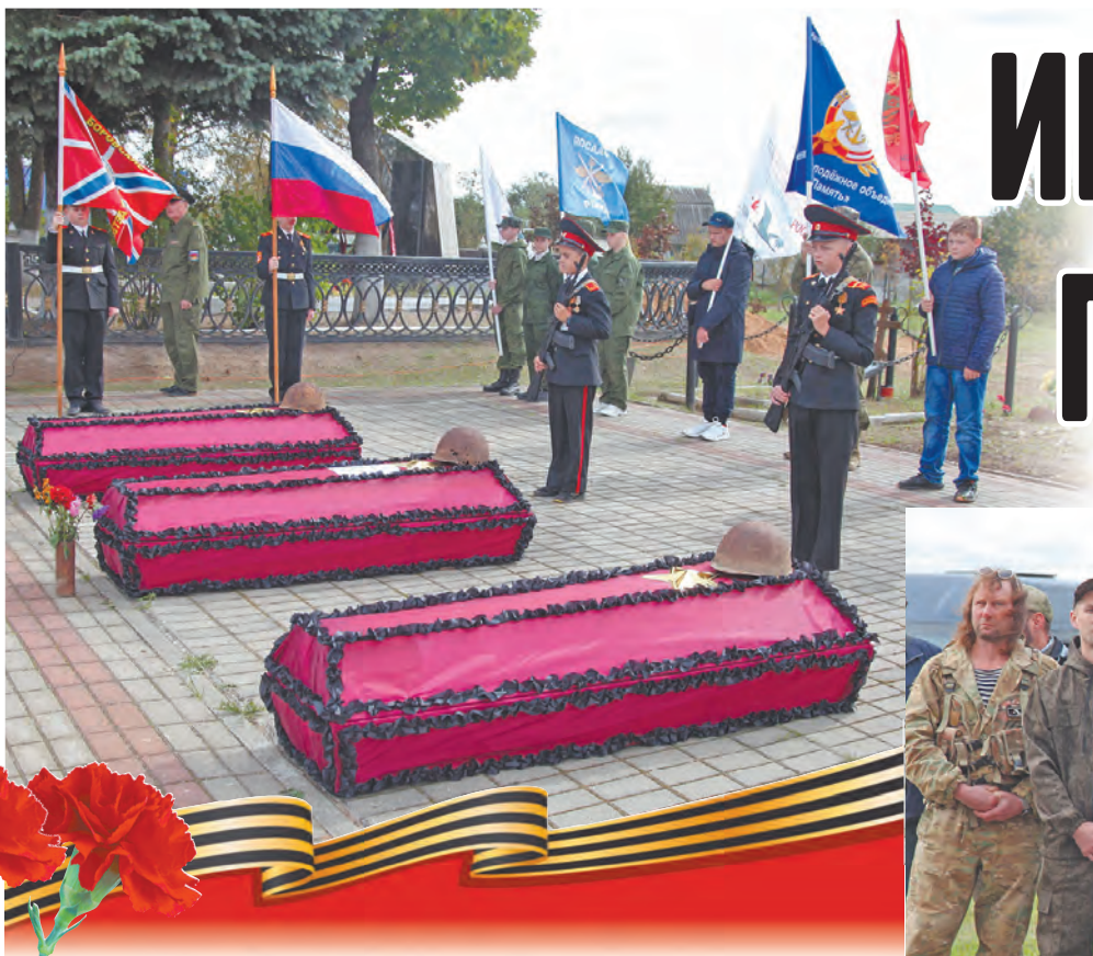
В Боровском районе состоялась церемония перезахоронения погибших в годы Великой Отечественной войны