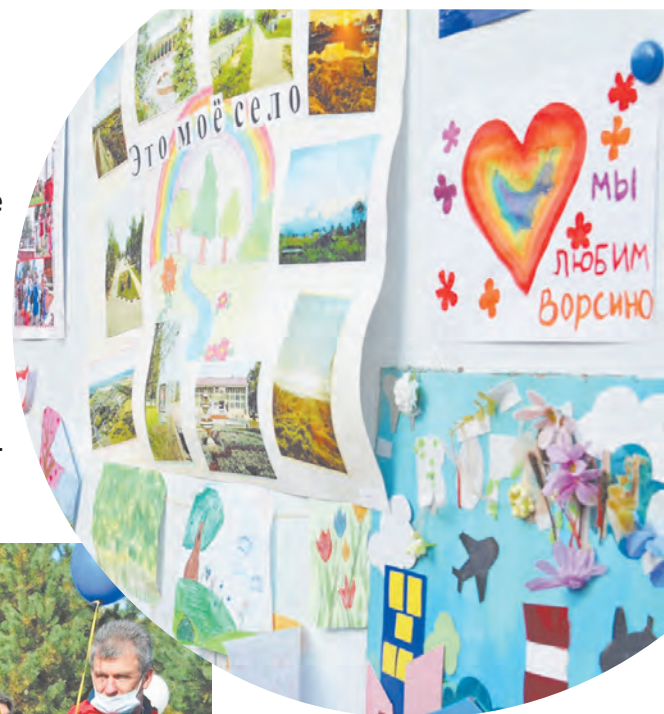
Ворсино. Рисунки местных юных художников.

Мастер-классы и катание на лошадях. Костюмированное шествие вместе с четвероногими питомцами. Обширная концертная программа с участием местных артистов и привлечением гостей из соседних и отдаленных мест. Конкурсы рисунков и чествование передовиков. Мотоциклисты и ходулисты, аквагим и аттракционы. Множество поздравлений, официальных и творческих. Музыка разных стилей и жанров, от русских народных напевов до самых современных ритмов. Так отметили боровчане традиционные «Дни села».