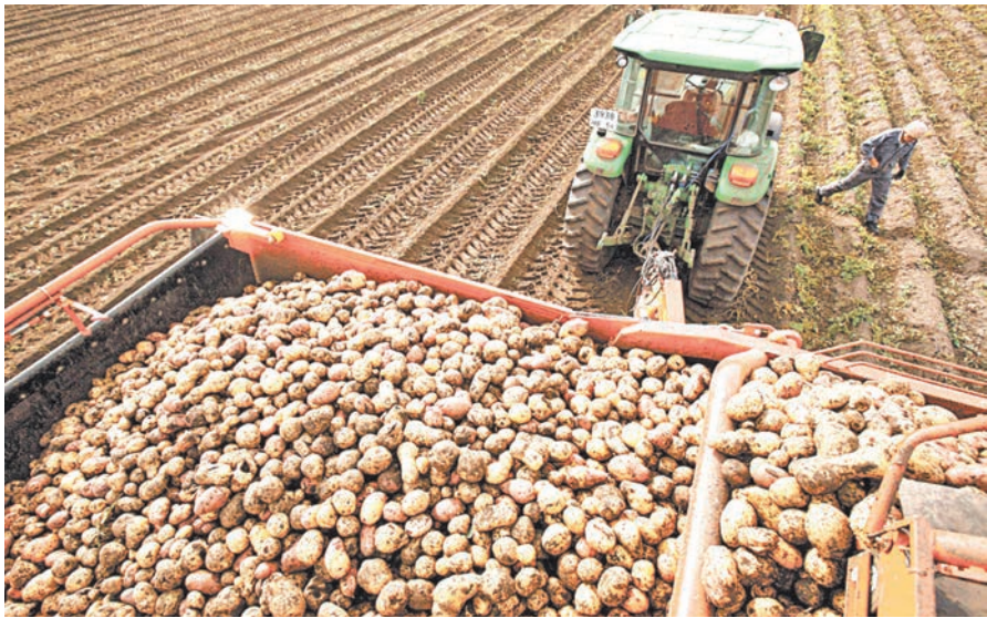
Уборка картофеля в Бабынинском районе.