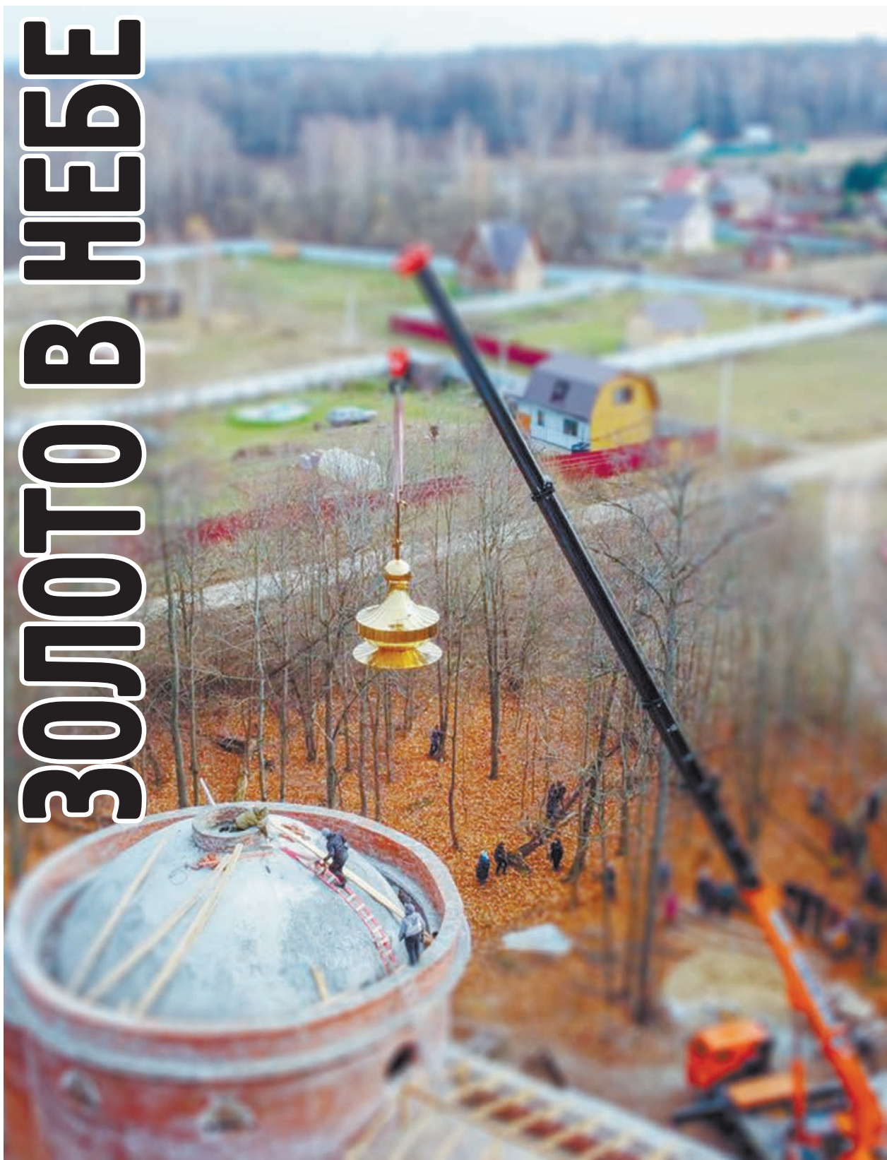
Храм в селе Ильинское.