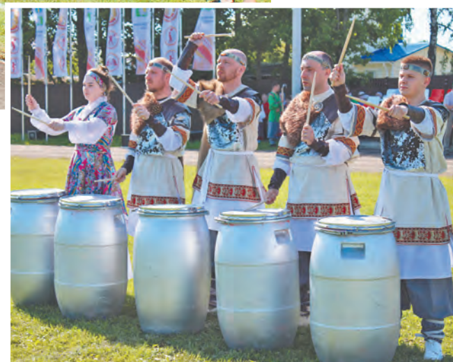
Барабанщики открыли торжественную часть.