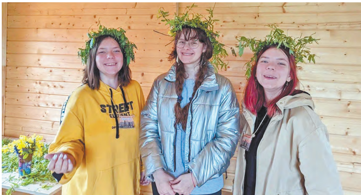
Мастер-класс по плетению венков.