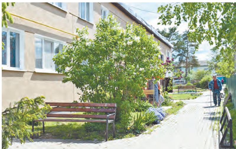
Строителей, 6, - благоустроенный двор.

его продолжают называть «барским садом»: парк был частью усадебного комплекса знаменитого дворянского рода Нарышкиных.