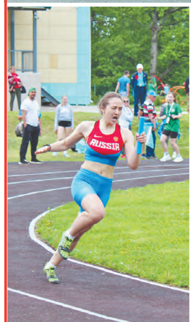
Азарт и стремление к победе каждого участника складывались в общий успех команды.