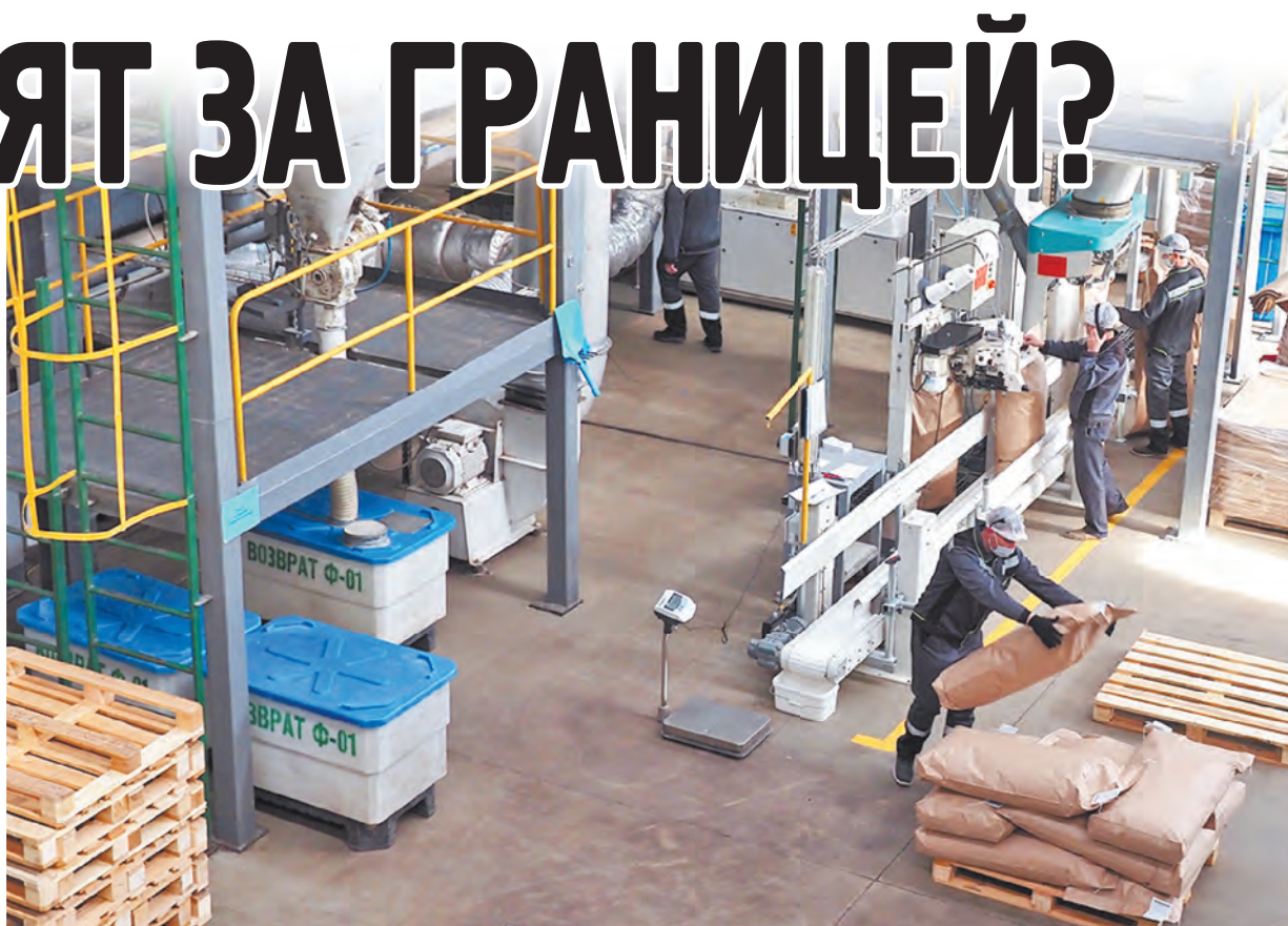
Производство в ЗАО «Партнер-М».

В рамках национального проекта «Международная кооперация и экспорт» сельхозтоваропроизводители области получают разнообразную государственную поддержку: от бесплатного исследования иностранных рынков до компенсации затрат на производство.