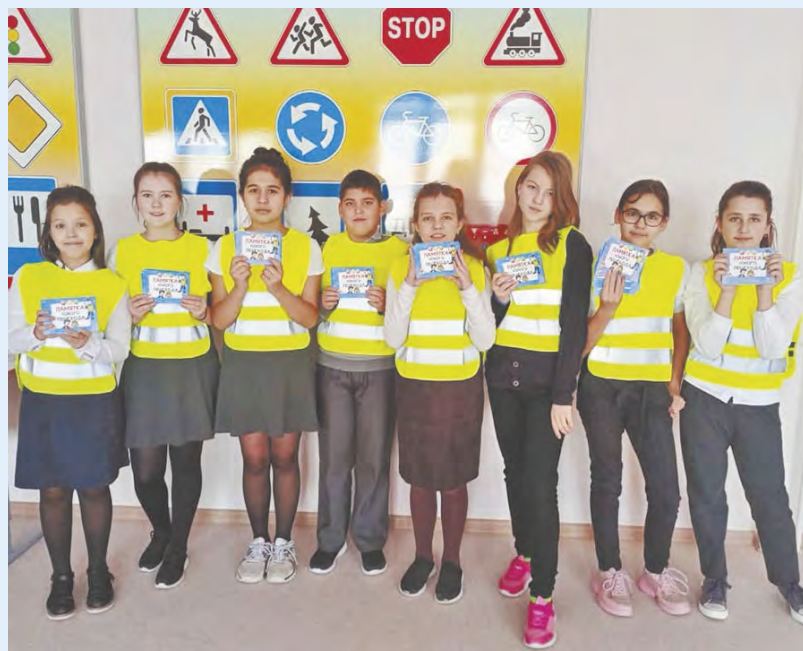
Отряд ЮИД «Движок» БСШ №5.