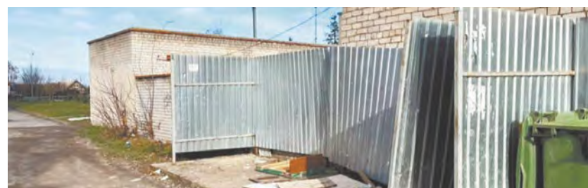
В Белоусове ликвидировали несанкционированную свалку.