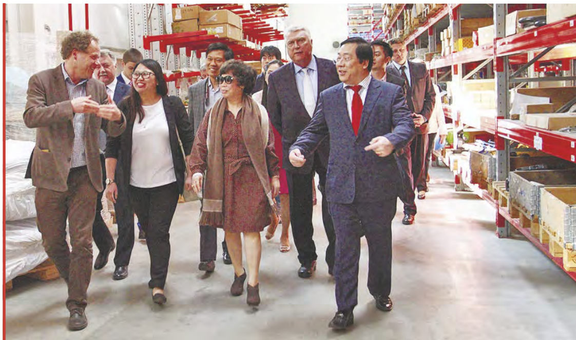
Вьетнамская делегация в агротехнологическом центре «Детчино».