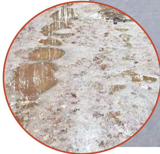
Обустройство дворовой территории на улице Гурьянова.

работу в свой город. Но Белоусово находится рядом с Обнинском, где заработная плата несколько выше, поэтому граждане не всегда выбирают место работы делают в пользу родного города. Сейчас местными властями прорабатывается вариант по содействию предоставления жилья сотрудникам полиции.