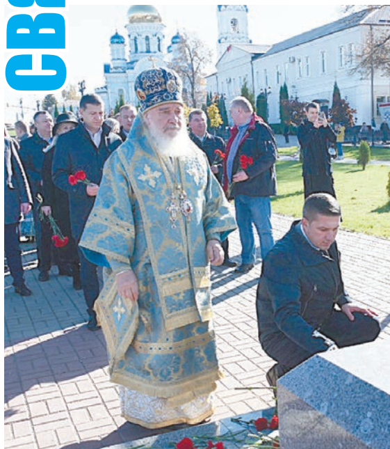
Окончание. Начало на 1-й стр.