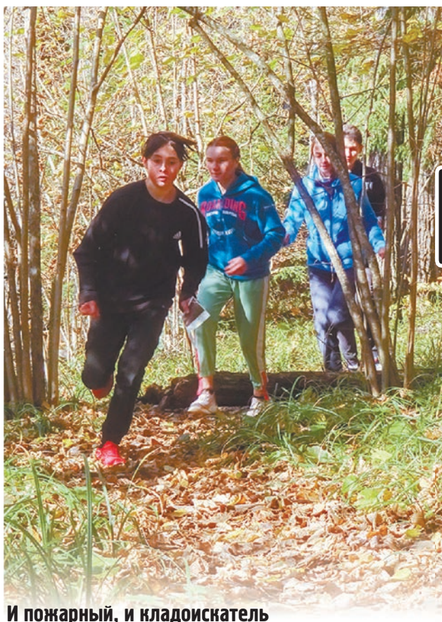
И пожарный, и кладоискатель

«Путь бойца» - так называлось патриотическое соревновательное мероприятие, посвященное 76-й годовщине Победы в Великой Отечественной войне. В состязаниях принимали участие школьники района, а также представители местных молодежных организаций и союзов.