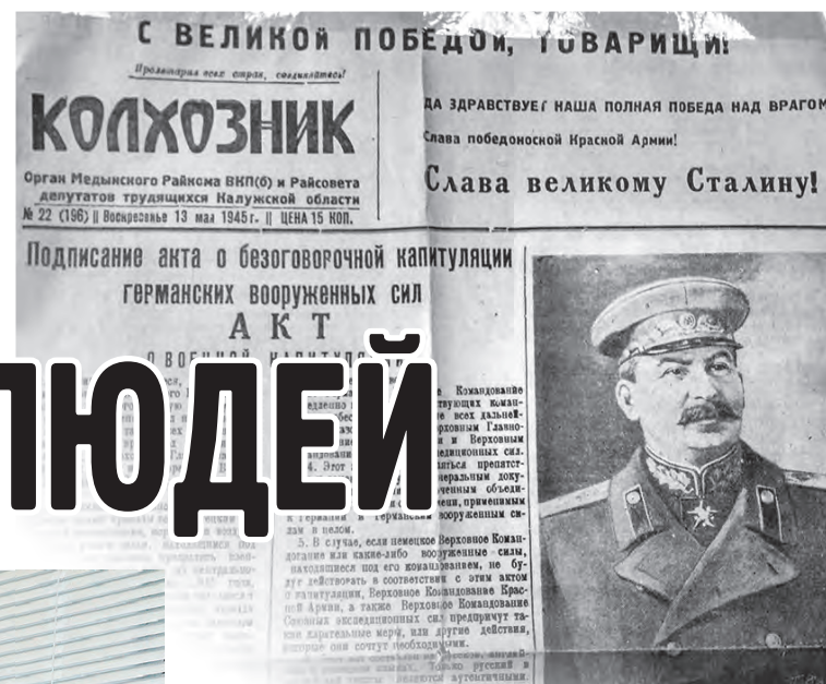
Номер газеты после Победы в Великой Отечественной.