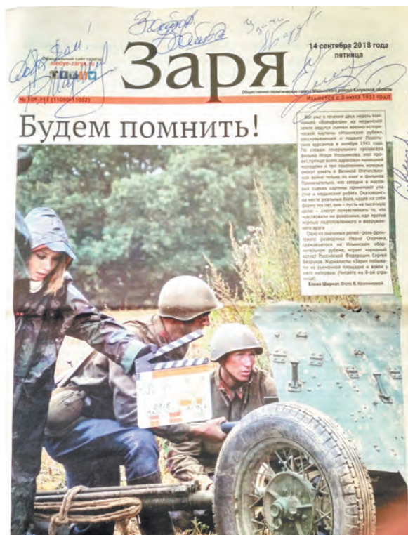
Номер со съемок Подольских курсантов с подписями актеров.

Продолжала работать районная журналистика и во время Великой Отечественной войны. Выходить газета стала сразу после освобождения города от немецких захватчиков в январе 1942 года. Издание было двухполосным, набиралось вручную. В те тяжелые годы газетной бумаги всегда не хватало, а полиграфическая ба-