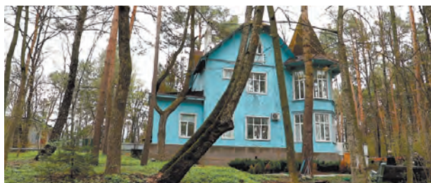
Дом-музей академика И.В. Курчатова.