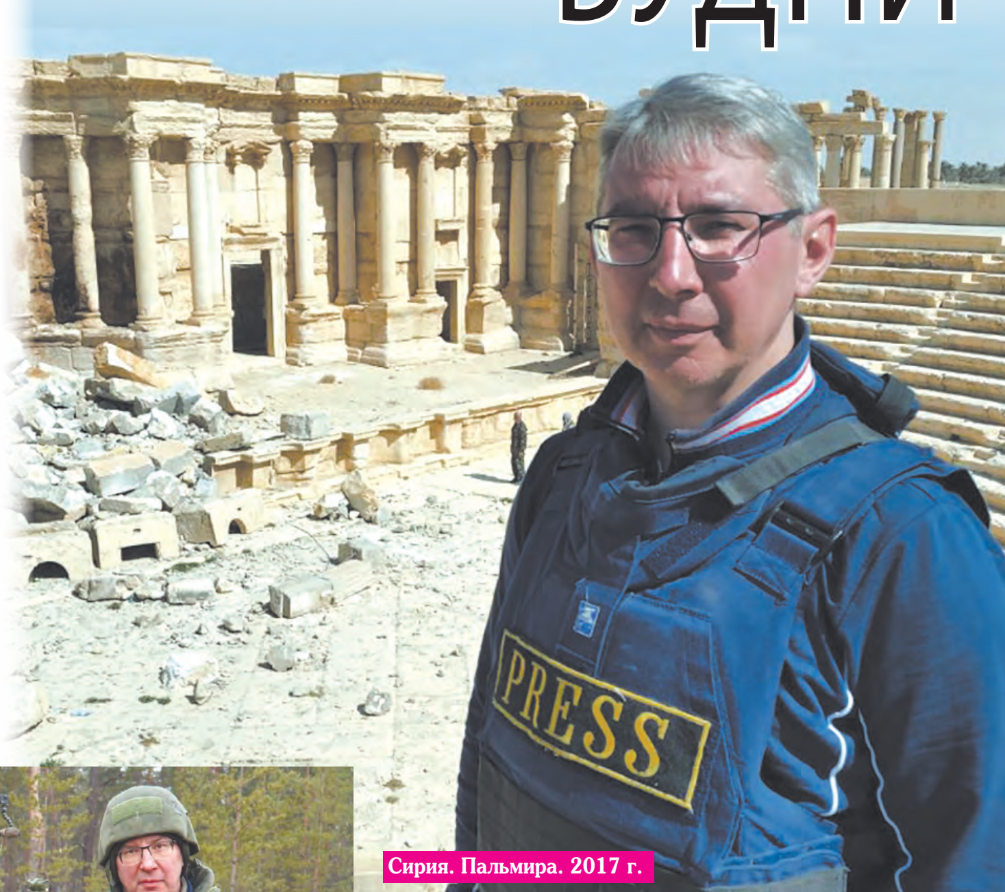
Сирия. Пальмира. 2017 г.