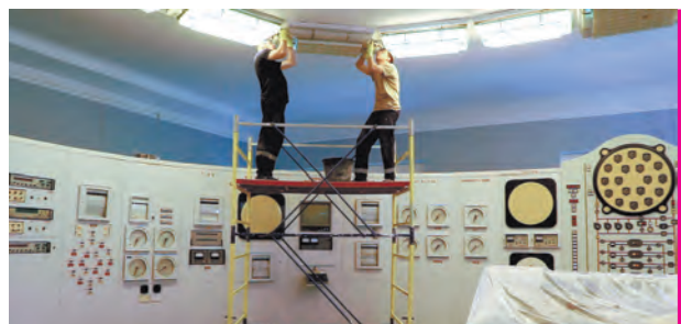
Будни атомной станции.