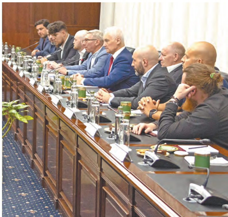
Встреча военков с министром обороны РФ Андреем Белоусовым 10 июня 2024 г.