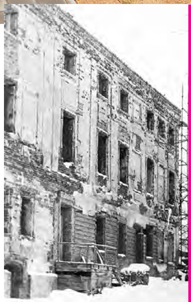
Начало 70-х годов XX века, южный фасад Дома Гончаровых.