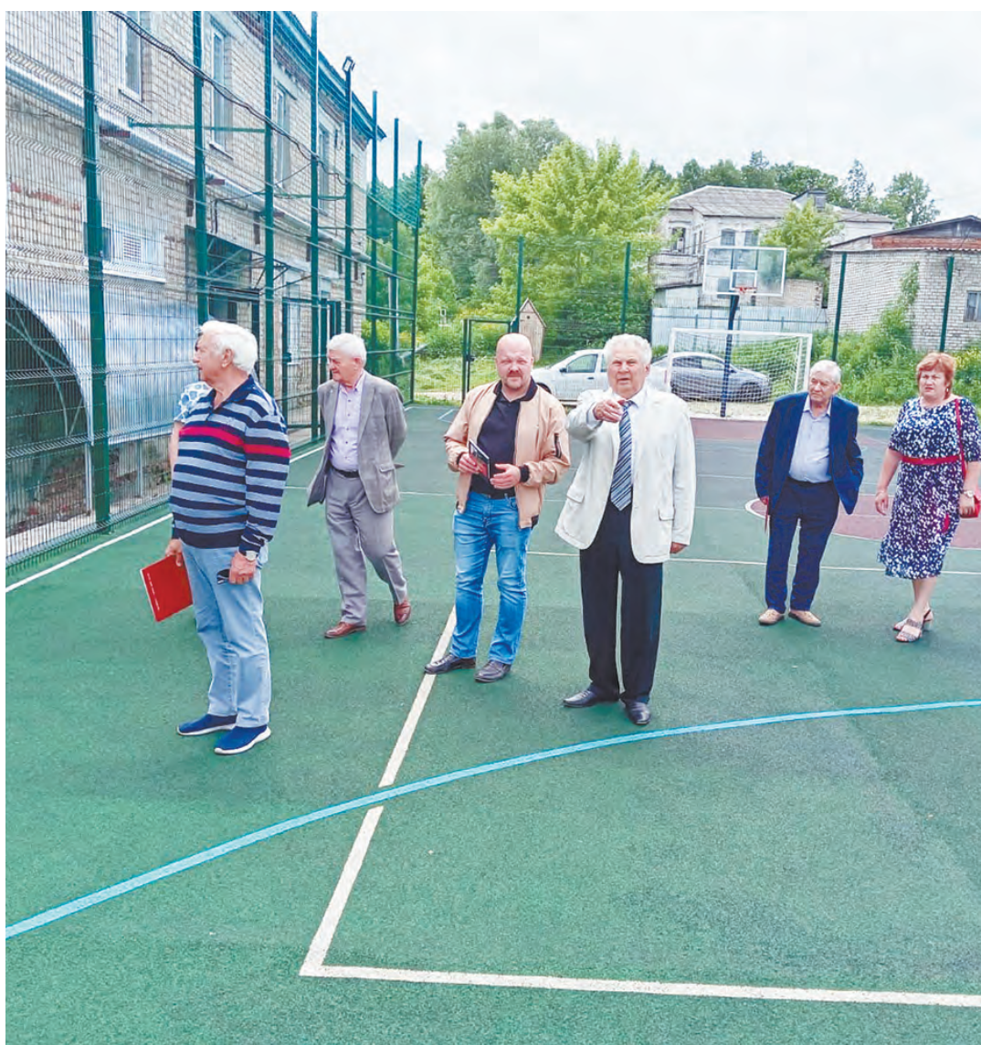
Участники совещания с интересом осмотрели спортивный комплекс.