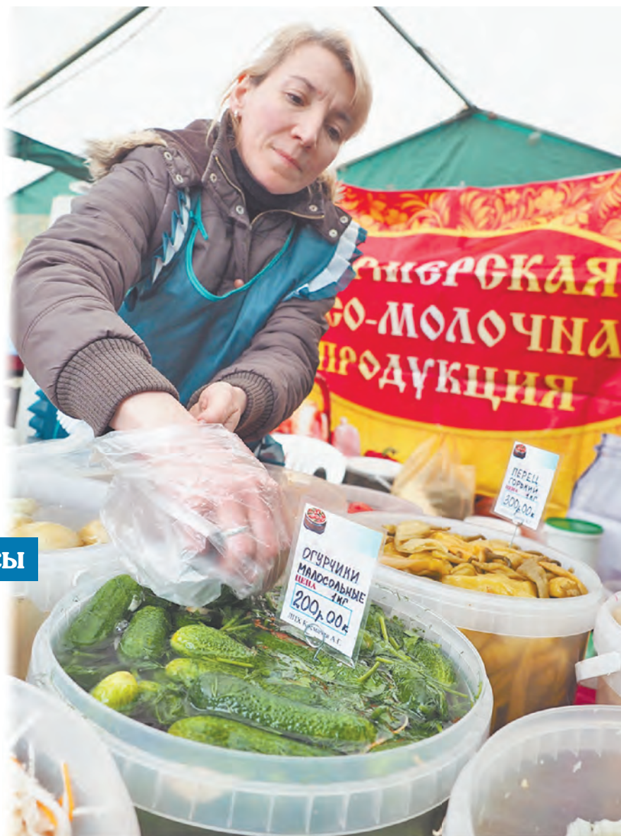
На ярмарке «Калужская осень».