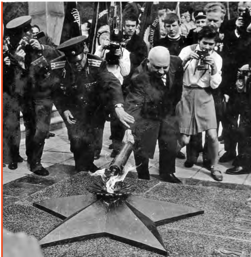
7 сентября 1969 г. Зажжение Вечного огня.

тия героев, символ благодарной памяти живущих о тех, кто ни крови своей, ни самой жизни не щадил, защищая Родину.