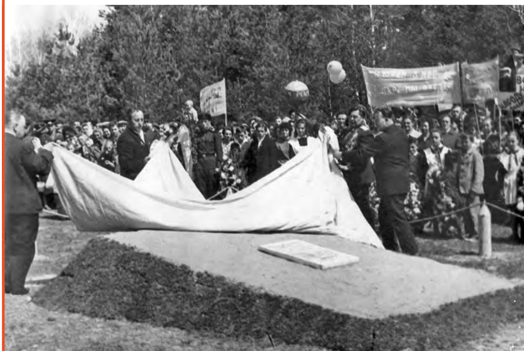
9 мая 1965 г. установлен закладной камень будущего памятника.