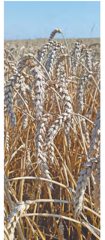
Заготовка кормов в Мосальском районе.