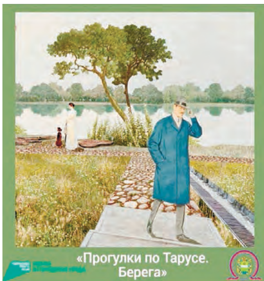
«Прогулки по Тарусе. Берега»