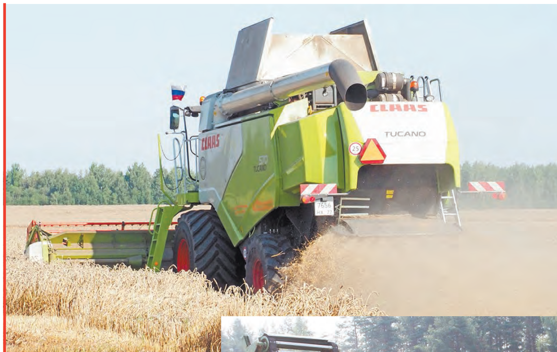
Уборка зерновых в ООО «Агрофирма «Мещовская».

В Козельском, Малоярославецком, Мосальском и Юхновском районах приступили к уборке ово-