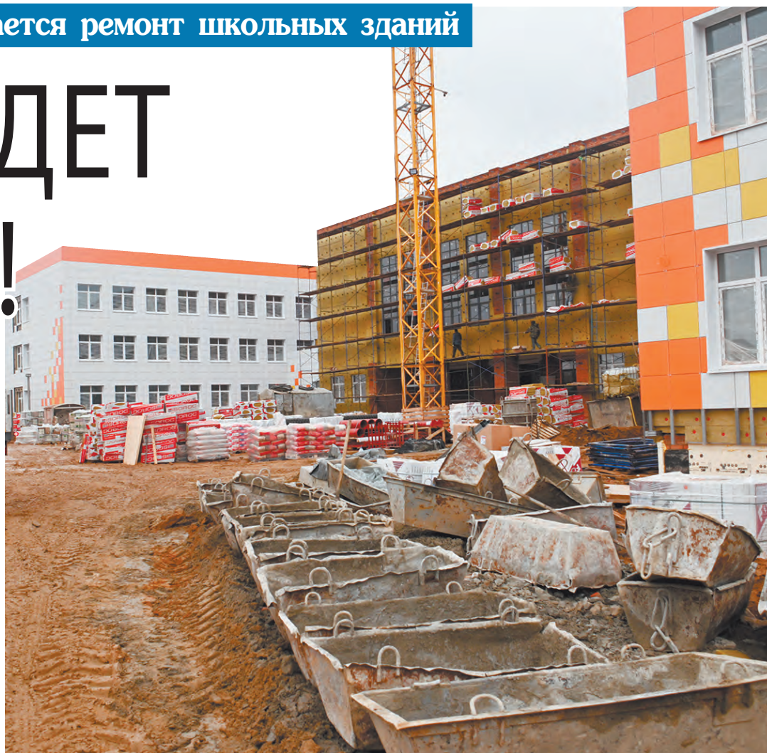
Школа в микрорайоне Заря.