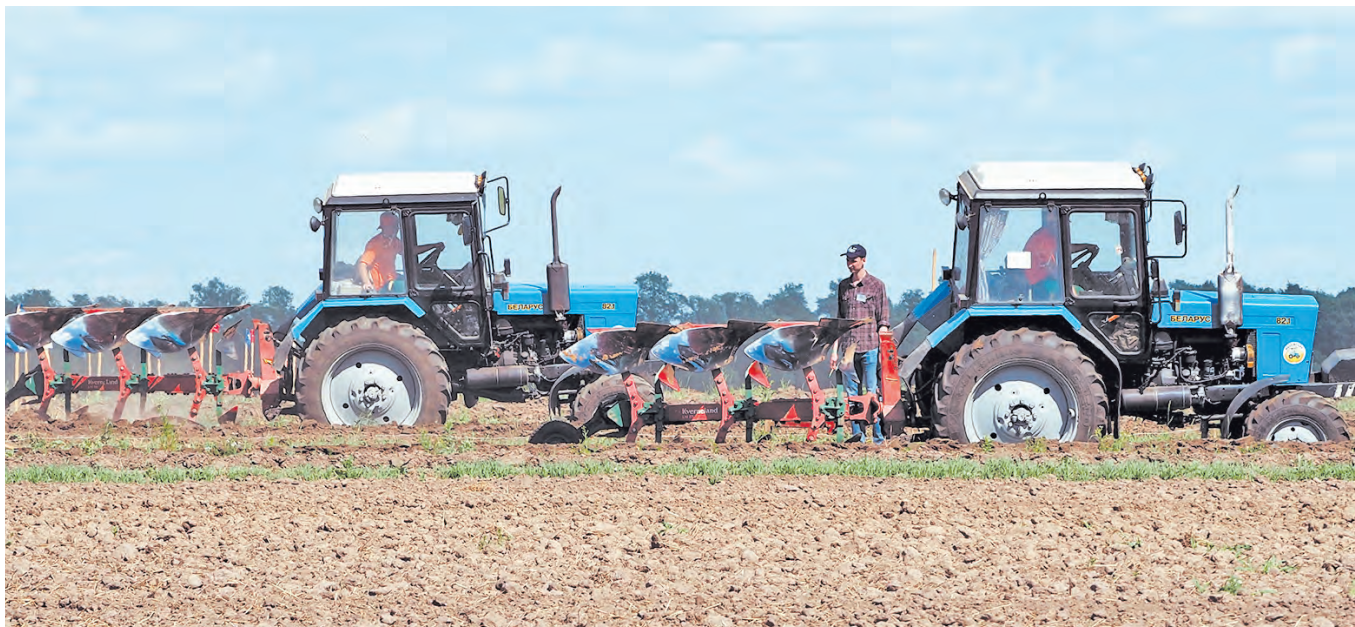
На посевной в Перемышльском районе.

Посевная кампания ведется практически во всех районах, а в некоторых она уже завершена. Учитывая проблемы весеннего сева в прошлом году, механизаторы трудятся в поле с повышенной отдачей, чтобы в оставшиеся майские дни завершить посадочные работы.