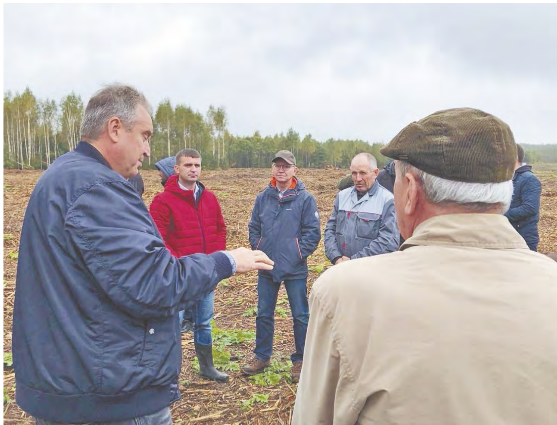
Использование мелиоративной бороны.

В нашей области ежегодно увеличиваются площади возвращаемых в оборот сельхозземель. Это особенно показательно на примере ООО «Алешино-Агро» - одного из трех хозяйств в нашей области, где реализуется инвестиционный проект известного литовского предпринимателя Вилюса Кайкариса по созданию семеноводческого хозяйства. И среди этих трех хозяйств именно мещовское является наиболее преуспевающим по урожаям выращиваемых здесь зерновых культур. А урожаи – рекордные! Средняя урожайность озимой пшеницы – 72 центнера с гектара. Поэтому крайне важно эффективно использовать каждый участок этих ценнейших, некогда заброшенных сельхоззе-