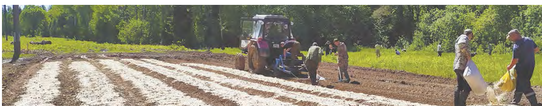
Виталий РОСТ. Фото автора и из архива Медынского лесничества.