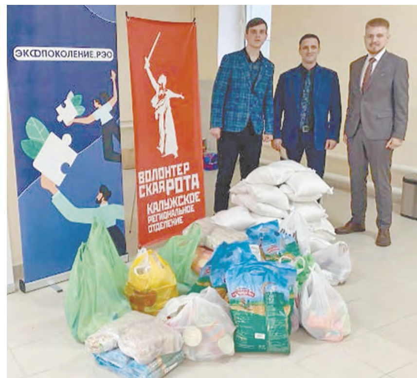
Фото районного совета отцов.