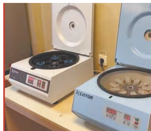
Новые центрифуги и дистиллятор.