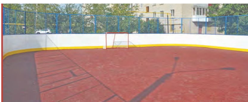
Балабаново, ул. Коммунальная после ремонта.

Некоторые поселения Боровского района, в том числе райцентр, по инициативному бюджетированию в течение нескольких предыдущих лет продвигали проекты, связанные с прокладкой инженерных коммуникаций на участках, где их раньше не было. Программа, в которой предусмотрено финансирование из местного, районного и регионального бюджетов, хорошо себя зарекомендовала, и в очередь на благоустройство и ремонт объектов встали даже ранее сомневавшиеся. В том же Совхозе «Боровском» имеется опыт разработки по «Инициативному бюджетированию» проекта газификации территории. С готовым проектом процесс вхождения в программу газификации значи-