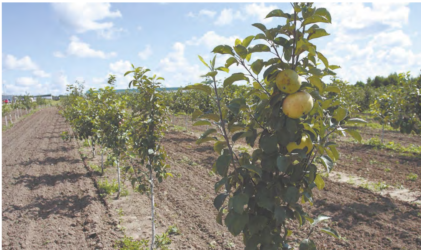
Молодые сады в ООО «Зеленые линии».