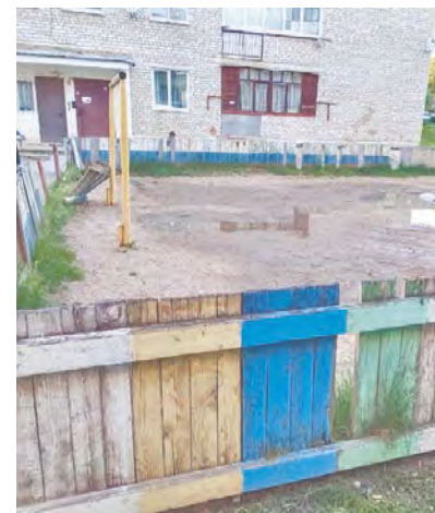
Боровск. ул. П.Шувалова до ремонта.