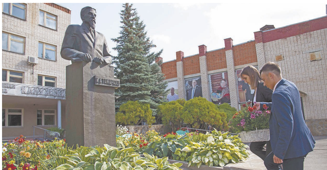
Возложение цветов к памятнику К.А. Тимирязеву.

Вручение символического ключа в страну знаний.