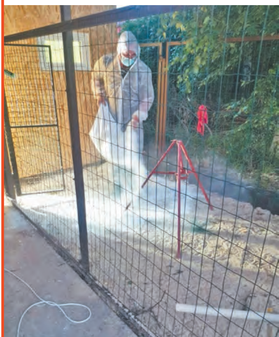
Дезинфекция очага заражения.

Мария БАЛАБИНА.