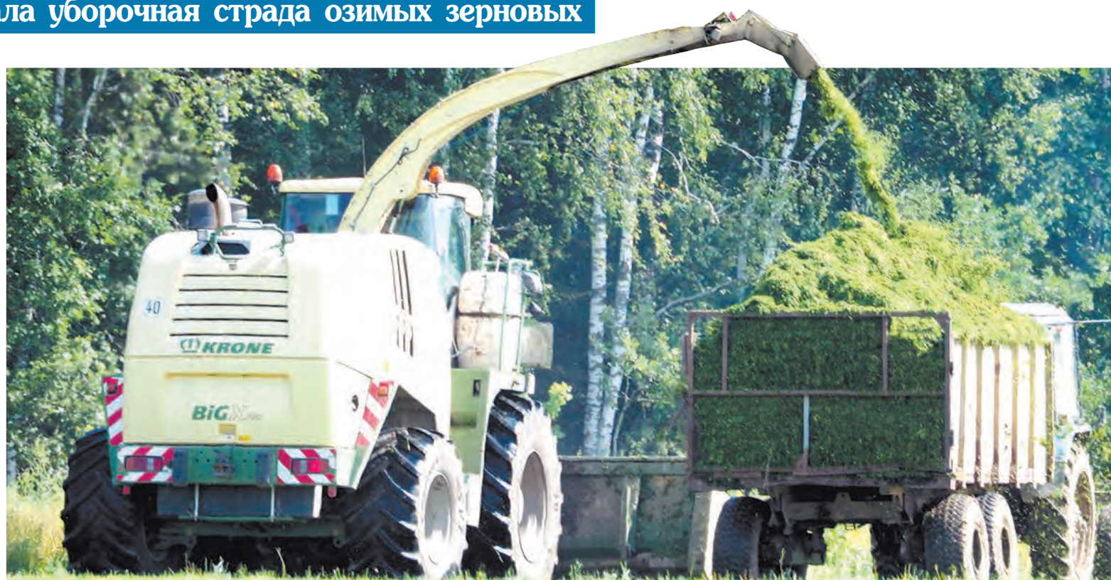
На заготовке кормов в Мосальском районе.

Жатва озимых началась ровно неделю назад с ООО «Агрофирма «Мещовская», а на этот момент к ней уже подключились хозяйства более десяти районов. По мнению специалистов регионального министерства сельского хозяйства, урожай зерновых выращен хороший, озимые успешно перенесли зиму, набрали большой колос. На сегодня убрано около 3 тысяч гектаров. А всего предстоит убрать озимые на общей площади 43 тысячи гектаров. Средняя урожайность, по прогнозам минсельхоза, ожидается более 35 центнеров с гектара. Это значительно выше, чем в прошлом году. Первопроходцы уборочной страды – ООО «Агрофирма «Мещовская» – уже показывают рекордные урожаи – 51 центнер с гектара! Причем в этом