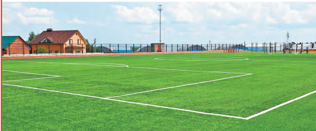
Спортплощадка новой школы на Заре.