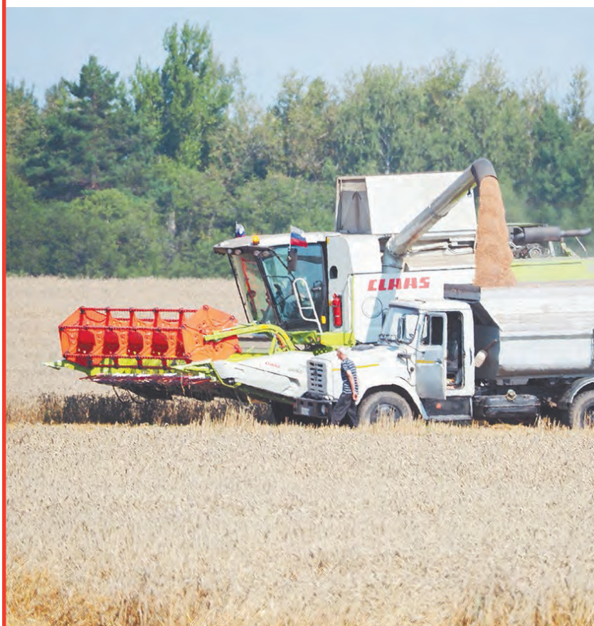
Жатва в ООО «Агрофирма «Мещовская».